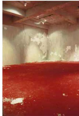
《矯揉造作》、洗衣粉混水泥、地毯現地裝置。 550x500x300cm，2003新樂園藝術空間 圖版提供 | 陳松志