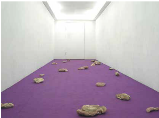
《奢侈的墮落》、口香糖、地毯、氣味現地裝置。 259x1219x244cm，2003高雄貨櫃藝術節

藝術家陳松志的創作一貫面對暗黑、負面，並提煉出悠長華光，在浮華的當代藝術界，是一個特別案例，這次獲選到LV旗艦店展覽，完全是一種張力充滿的情境。