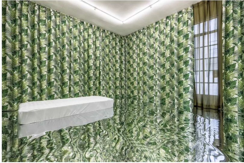
陈松志《无题·房间 5 (静物)》，2018 年 现地装置，纺织面料，床垫，PE 面板，收音机

份权力回馈给所有来到展厅的观众——因为他所反复提及的，其实都是大家在生活中经常涉及但未曾注意的日常经验与细节碎屑。不难发现，艺术家绝大部分的作品都是运用建筑装饰材料，基色整体提纯，植物的窗帘其实也只是原型树叶图片的分形重叠。可能最为嘈杂的，还是周边上海弄堂的真实环境：显然，我们的现实远比收音机调频中传递的内容本身要复杂与丰富。