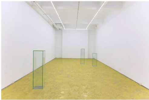
陈松志《无题》，2017 年，现地装置，玻璃，金色亮粉

毫无疑问，坐落在上海的种种艺术基建空间，已经成为了网络红人比拼人像摄影技术最激烈的新竞技场。上海的观众对艺术普遍热情高涨，他们非常耐心，面对看展买票排队早已感到理所应当。随着那些使用专业拍摄器材有备而来的人群越发庞大，在美术馆或是艺术空间拍照，已经成为情侣维持感情所必不可少的一条重要纽带。展品作为绝佳的背景，在变化涂抹的，其实只是站在展品前各式各样的人。于是，美术馆工作者的警戒时间（alert time）也随之被大幅拉长。