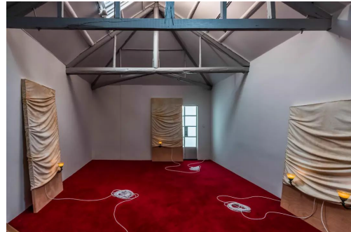
(左)陈松志《散场》，2017 年，现地装置，尼龙地毯，香氛 (右)陈松志《倒装的语句》，2018 年，现地装置，番茄酱，麂皮绒面料，电线，壁灯